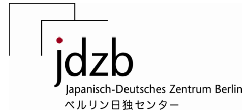
ベルリン日独センター